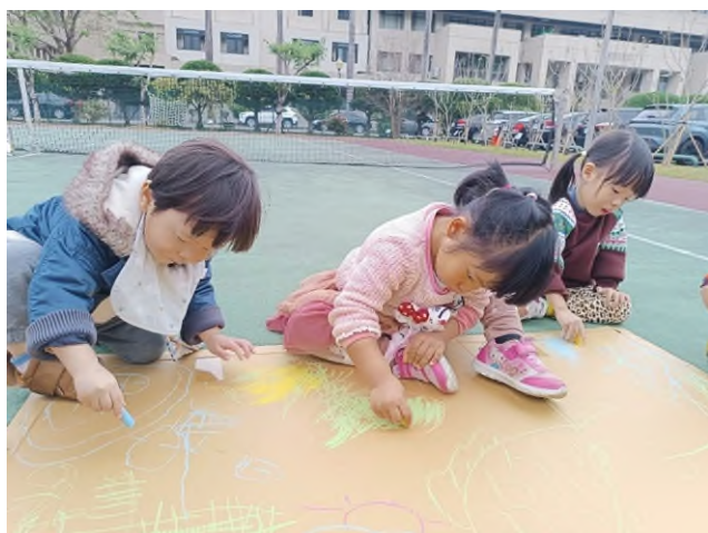
大地彩繪:合作學習~~創藝畫