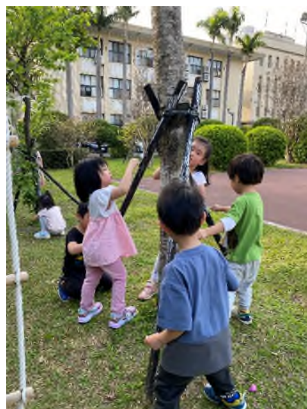
兒童藝術家:樹的彩繪