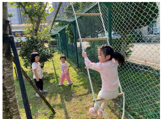
我們的遊戲:勇於探索~~盪鞦韆