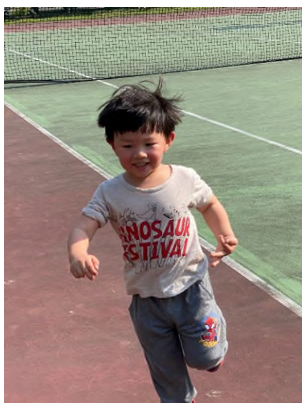
體能活動:感統訓練~~賽跑