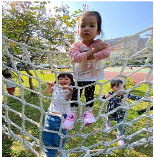
大肌肉活動:體能訓練~~攀繩索