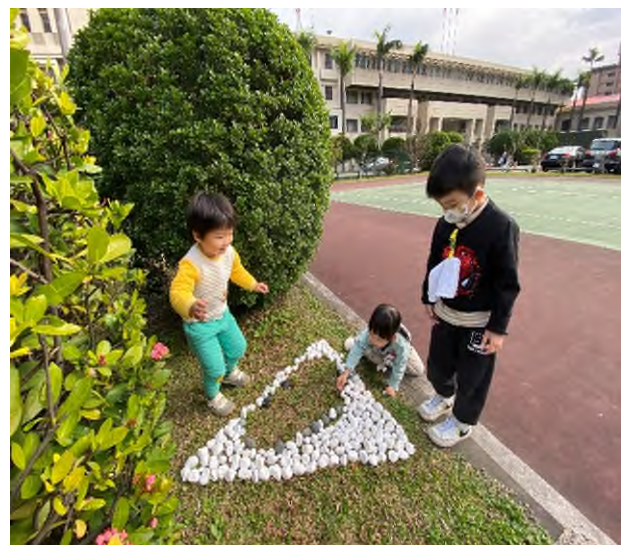
遊戲學習：快樂、合作與主動自主學習