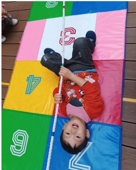
感統訓練：前庭發展