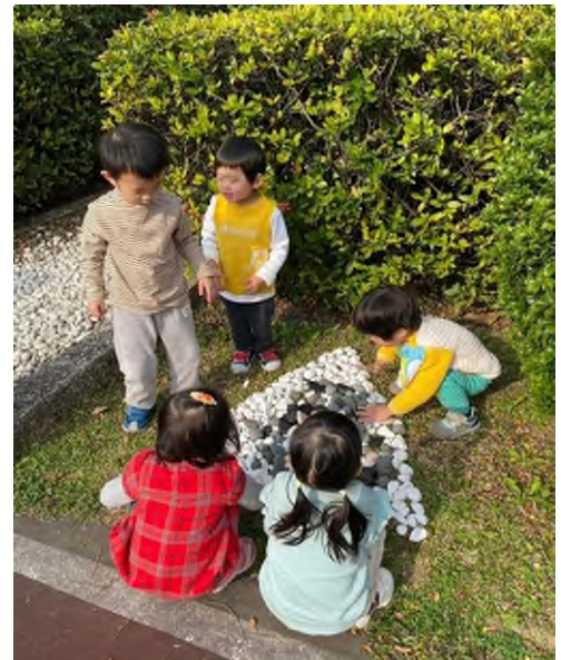
鬆散素材：石頭探索與合作學習~美感