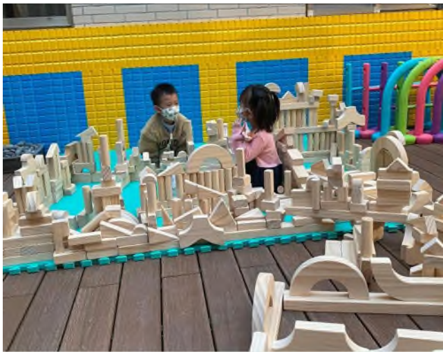
幾何積木建構:邏輯幾何概念~~拜登鐵塔