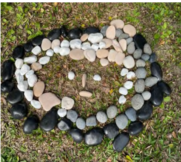
美感：訓練圖說能力~~藝術創作語言