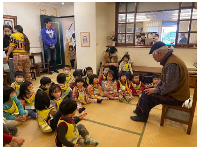
兒童哲學:楊爺爺說故事