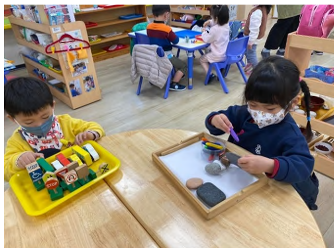
主題與學習區探索:數學、藝術