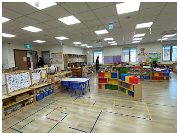
有機學習環境:學習區介紹~六大領域