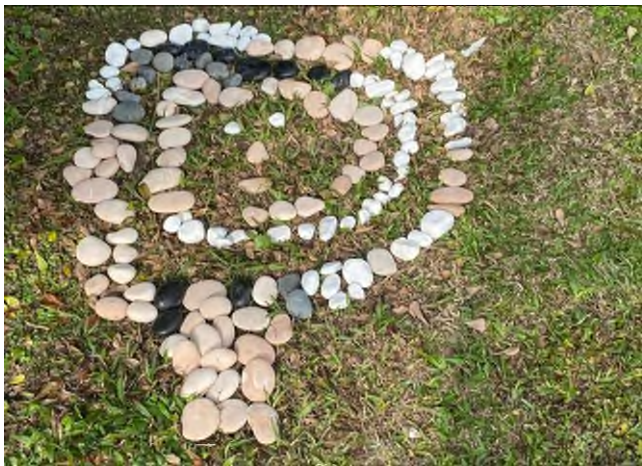
鬆散素材:專注力精細動作~石頭創作