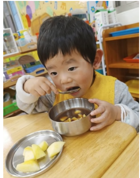
美食：營養點心~~紅豆湯元宵