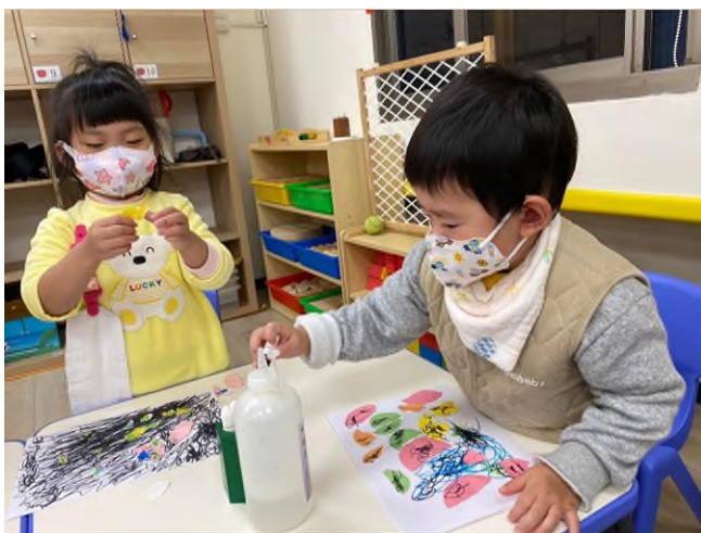
藝術創作:美感~~塗鴉撕貼創作畫