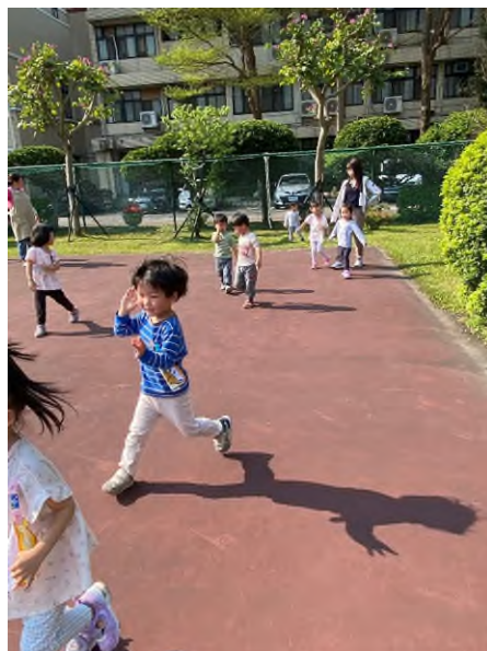
大肌肉活動:跑~跳~追