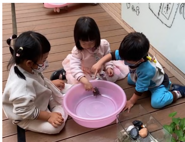
生命教育:愛護動植物與照顧~~飼養烏龜