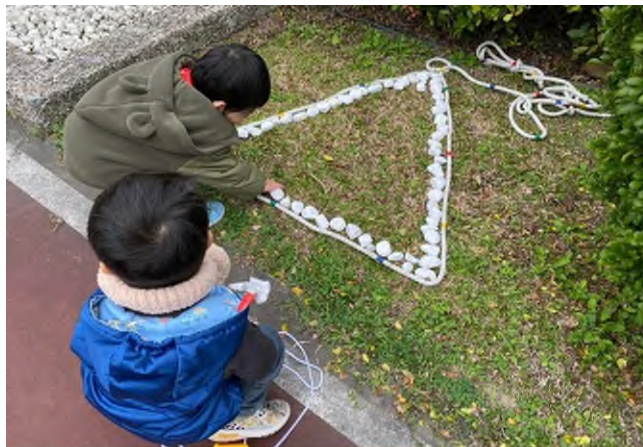
鬆散素材:石頭排列點、線、面構成圖